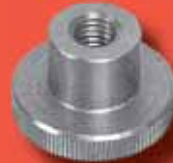
Rändelmutter DIN 466 A2