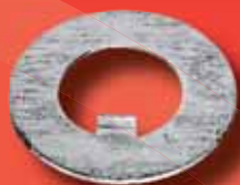
Sicherungsbleche DIN 462 A2/A4