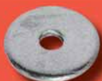
Unterlegscheiben DIN 1052 A2/A4