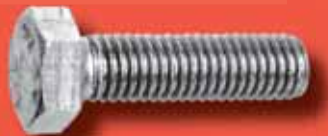
Sechskantschrauben ISO 4017 A2/A4