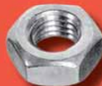
Sechskantmuttern DIN 934 A2/A4/1.4571