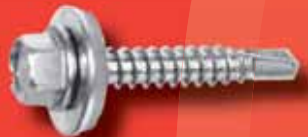
Sechskant- Bohrschrauben DIN 7504 KO A2