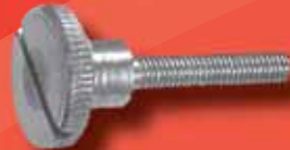
Rändelschrauben DIN 465 A2