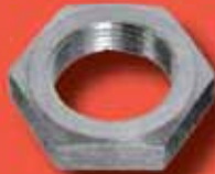
Rohrmuttern DIN 431 A2/A4 (G)