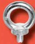
Ringschrauben DIN 580 A2/A4