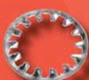
Zahnscheiben DIN 6797 I A2