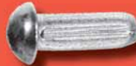
Halbrundkerbnägel DIN 1476 A2