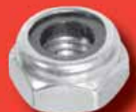
Stopmuttern niedrige Form DIN 985 A2/A4