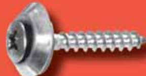
Spenglerschrauben 3 tlg. Art.-Nr. 9067-3-0 A2