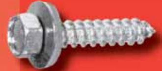
Fassadenschrauben Art.-Nr. 79 A A2