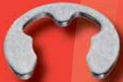
Sicherungsscheiben DIN 6799 A2/A4