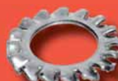
Fächerscheiben DIN 6798 A A2/A4