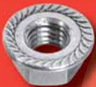
Sechskantmuttern DIN 6923 A2/A4