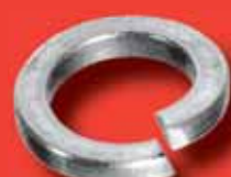
Federringe DIN 7980 A2/A4