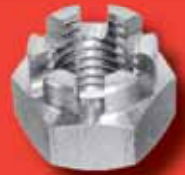
Kronenmuttern DIN 935 A2/A4