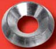
Unterlegscheibe für Senkschrauben ~SN 213912-A1