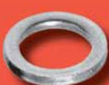
Unterlegscheiben DIN 1441 A2/A4