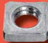
Vierkantmuttern DIN 562 A2/A4