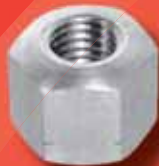
Sechskantmuttern DIN 6330 A2/A4 (1,5d)