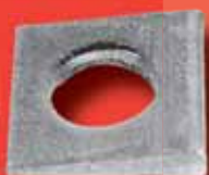
Keilscheiben (14%) DIN 435 A2/A4