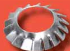
Fächerscheiben DIN 6798 V A2/A4