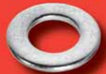
Unterlegscheiben DIN 125 A2/A4/1.4571