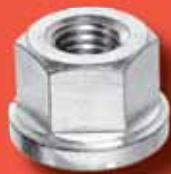
Sechskantmuttern DIN 6331 A2/A4