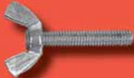
Flügelschrauben (gepresst) ähnlich DIN 316 A2/A4 amerik. Form