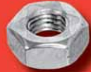
Stopmuttern Ganzmetall DIN 980 A2/A4