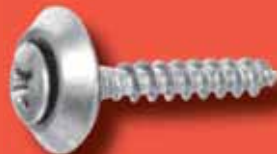
Spenglerschrauben 3 tlg. Art.-Nr. 9067-3-1 A2