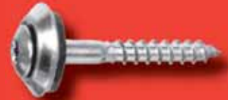
Spenglerschrauben Art.-Nr. 9087-3-0 TX A2