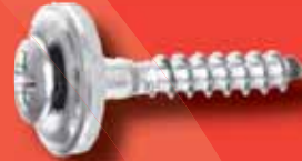
Spenglerschrauben 2 tlg. Art.-Nr. 9067-2-0 A2