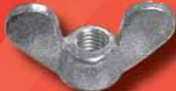
Flügelmuttern (geschmiedet) DIN 315 A2/A4