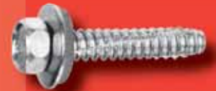
Fassadenschrauben Art.-Nr. 79 BZ A2