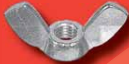
Flügelmuttern (gepresst) ähnlich DIN 315 A2/A4 amerik. Form