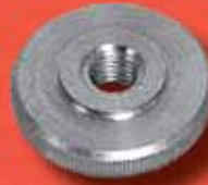
Rändelmutter DIN 467 A2