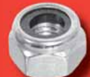
Stopmuttern hohe Form DIN 982 A2/A4