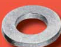
Unterlegscheiben DIN 1440 A2/A4