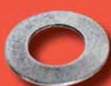
Tellerfedern DIN 2093 A2