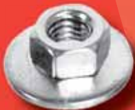
Kombimuttern Art.-Nr. 9085 A2