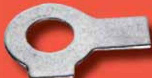
Sicherungsbleche DIN 463 A2/A4