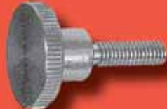
Rändelschrauben DIN 464 A2