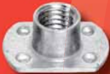
«L»-Anschweissmuttern Art.-Nr. 9060 A2