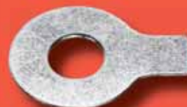
Sicherungsbleche DIN 93 A2/A4