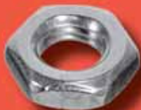
Sechskantmuttern DIN 439 A2/A4