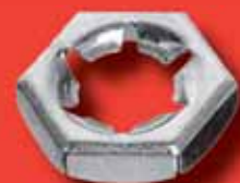
Sicherungsmuttern DIN 7967 A2/A4