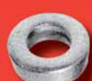
Unterlegscheiben DIN 7989 A2/A4