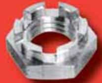
Kronenmuttern DIN 979 A2/A4