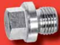
Verschlusschrauben DIN 910 A2/A4