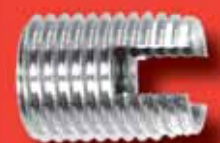
Gewindeeinsätze Art.-Nr. 9058 A2