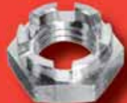
Kronenmuttern DIN 937 A2/A4