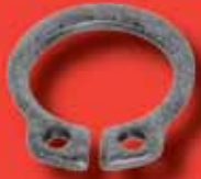
Sicherungsringe DIN 471 A2