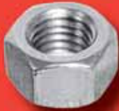
Sechskantmuttern ISO 4032 A2/A4