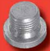
Verschlusschrauben DIN 908 A2/A4