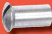
Hülsenmuttern Art.-Nr. 9061 A2/A4