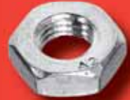
Sechskantmuttern DIN 936 A2/A4