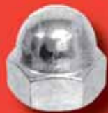
Sechskant-Hutmuttern DIN 1587 A2/A4