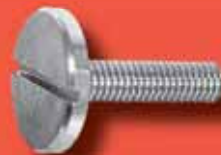
Flachkopfschrauben grosser Kopf DIN 921 A2