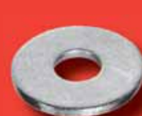
Unterlegscheiben DIN 9021 A2/A4