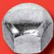
Sechskant-Hutmuttern DIN 917 A2/A4