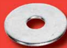
Carrosseriescheiben Art.-Nr. 7187 A2/A4