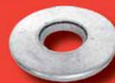
Dichtscheiben Art.-Nr. 9055 A2