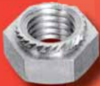
Setzmuttern Art.-Nr. 9064 A2