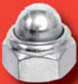
Sechskant-Hutmuttern DIN 986 A2/A4