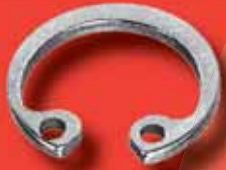
Sicherungsringe DIN 472 A2