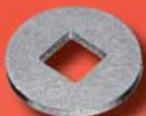
Unterlegscheiben DIN 440 V A2/A4