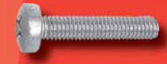
Linsenschrauben DIN 7985 PH A2/A4