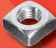
Vierkantmuttern DIN 557 A2/A4