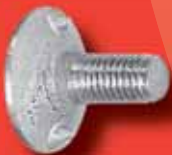
Tellerschrauben DIN 15237 A2/A4