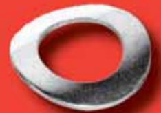
Federscheiben (gewölbt) DIN 137 A A2