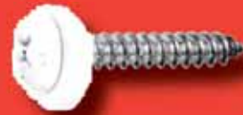
Fensterbankschrauben div. Farben Art.-Nr. 9066 A2