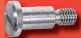
Flachkopfschrauben mit Ansatz DIN 923 A2