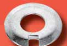
Sicherungsbleche DIN 432 A2/A4