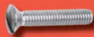
Linsensenkschrauben DIN 964 A2/A4 ~VSM 13328-A2-LSK