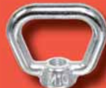
Korbmuttern DIN 80704 A4