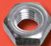
Sechskant-Schweissmuttern DIN 929 A2/A4