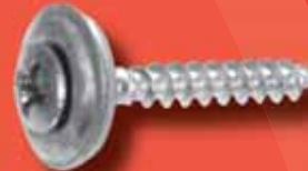
Spenglerschrauben 2 tlg. Art.-Nr. 9067-2-1 A2