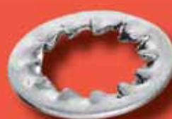
Fächerscheiben DIN 6798 I A2/A4