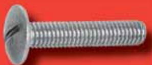
Becherschrauben Art.-Nr. 7770-A2