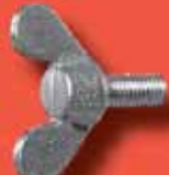
Flügelschrauben (geschmiedet) DIN 316 A2/A4