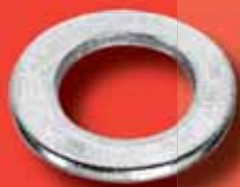
Unterlegscheiben DIN 433 A2/A4