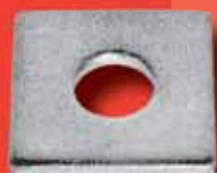
Vierkantscheiben DIN 436 A2/A4