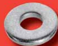
Unterlegscheiben DIN 7349 A2/A4