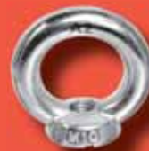
Ringmuttern DIN 582 A2/A4