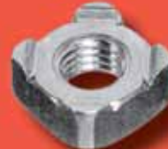
Vierkant-Schweissmuttern DIN 928 A2/A4