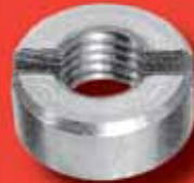
Schlitzmuttern DIN 546 A2/A4