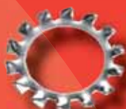
Zahnscheiben DIN 6797 A A2