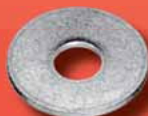
Unterlegscheiben DIN 440 R A2/A4