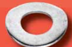
Federscheiben (gewellt) DIN 137 B A2