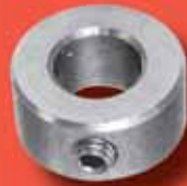
Stellringe DIN 705 A2