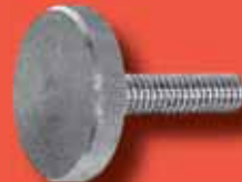
Rändelschrauben DIN 638 A2