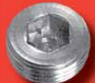
Verschlusschrauben DIN 906 A2/A4