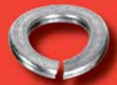
Federringe DIN 128 A A2/A4