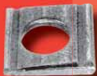
Keilscheiben (8%) DIN 434 A2/A4