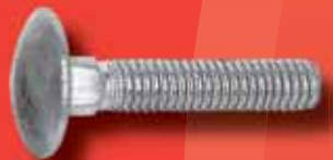
Flachrundschrauben DIN 603 A2/A4