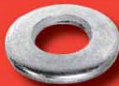
Spannscheiben DIN 6796 A2/A4 (SN 212745)