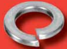
Federringe DIN 127 B A2/A4